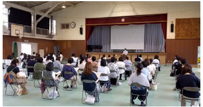
↑ 保護者説明会の様子

さて、7月3日（金）に、各学年の保護者説明会を開かせていただきました。（右写真）ご多忙中にもかかわらず、大勢の方にご参加いただき、ありがとうございました。長期間にわたる学校の休業があり、また、新型コロナウイルス感染症が流行する中で、保護者の皆様は多くの不安を感じられていることと思います。少しでも、不安を解消していただくために、今後の教育活動計画や学習について説明させていただきました。当日参加できなかった方にもご理解いただけるように、説明会でお伝えした内容を含めて簡単にご説明させていただきます。（教育課程説明会の資料もご参照ください。）