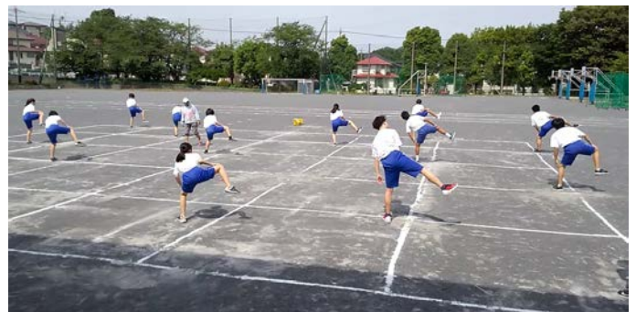
↑体育の授業風景 グラウンドに引かれたマス目に立って運動

3年生にとっては、有終の美を飾るはずだった最後の公式戦やコンクールなどがなくなり、非常に残念でした。しかし、活動がはじまると、とても楽しそうに取り組み、私たち教職員の方がホッとさせられました。競技種目によっては、近隣の学校どうしで引退前の試合が計画されています。よい伝統を後輩たちのために残してもらえんと思います。今後、活動の範囲も広がっていきますので、子どもたち自身が、感染症対策をよく理解し、自分でも判断して行動できるように指導をしていきたいと思えます。