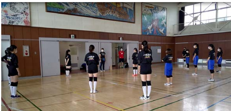
↑部活動再開のミーティング風景

下の写真は、7月からの部活動再開のときのミーティングの様子です。密集を避け、ソーシャルディスタンスをとりながらの集合でしたが、顧問の先生からの感染症予防や熱中症予防についての注意を真剣に聞いています。