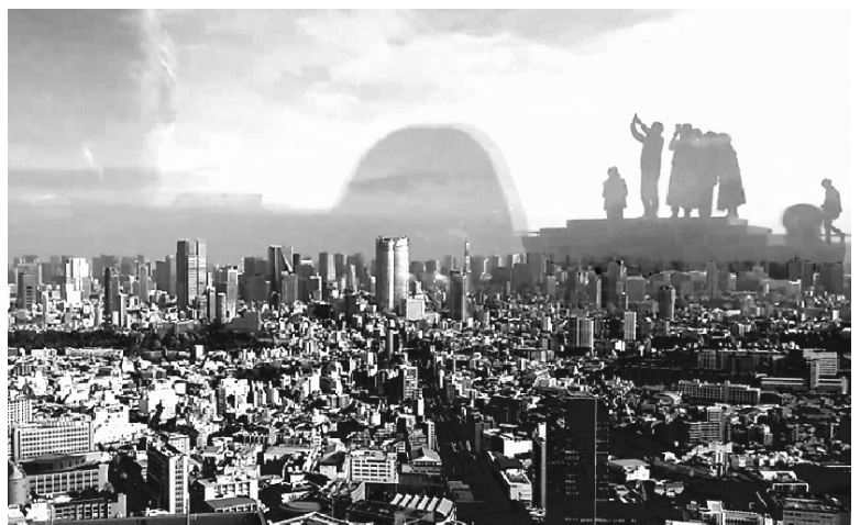
↑新しくできた渋谷のビルの屋上からの発展する大都会の風景とガラスに映り込んだ人(右上)が空を見上げる様子

よく「失ってから初めてその価値が分かる」と言われますが、まさに「健康」がその一つです。