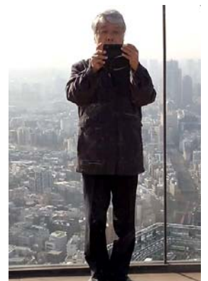
↑ビルの屋上で自画撮り(わたしです 校長)

先日の始業式では、生徒の皆さんにも、何かの参考にして欲しいと思い、この話をしました。