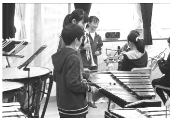
部活動体験の様子

授業見学終了後には、6年生が各自で希望した部活動で体験を行いました。どの部活動でも真剣に中学生の話を聞きながら、楽しそうに生き生きと活動する小学生の姿が見られました。また、小学生に少しでも部活動の良さを伝えようと工夫する中学生の姿も印象的でした。