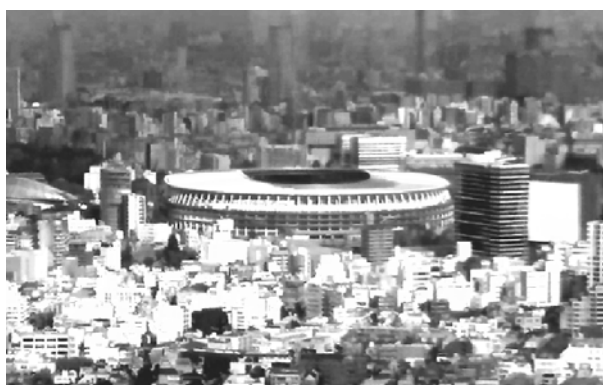
↑ビルの屋上から見た新国立競技場

正月明けに、私は、渋谷に新しくできた地上約230mの高層ビルの屋上へ行きました。そこで、発展する大都会を見ることができました。できたばかりの新国立競技場も見えました。今年は、ここで東京オリンピックが開催されます。