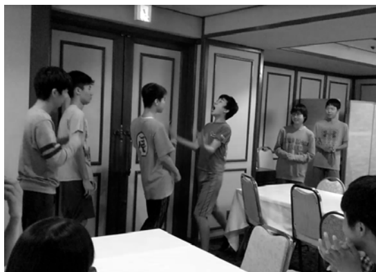
↑モツアレラチーズゲームで盛り上がっています