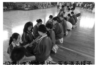
協力して竹筒でビー玉を送る様子

私は今回の活動を通して仲間との団結力がいかに大切かをあらためて学ぶことができました。困難なことでも仲間と団結すれば必ず前へ前へと進むと感じられたこと、そして成功した時の大きな達成感を得られたことが大きな収穫だと思います。PAAで成功した時の達成感を忘れず、これからもクラスだけでなく、学年全体で力を合わせて、みんなで一つのゴールに向かっていきたいと思っています。