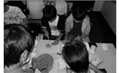
和菓子作り体験の様子

修学旅行で深まった絆をこれからも大切に、これからの体育祭や合唱コンクールなどの学校行事でも互いの個性を認め合い、そして団結していきたいと思っています。