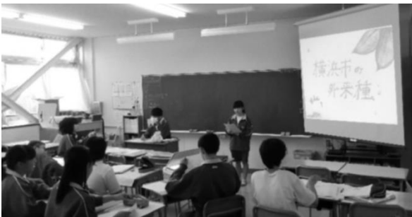
【グループ発表の様子】

10月19日(金)3、4校時にグループ別発表会。24日(水)3、4校時に学年発表会が行われました。2学年のテーマは『横浜』。いろいろな施設に足を運んだり、インタビューをしたりと昨年よりもグレードアップした発表がたくさんありました。資料作成にも時間をかけていていい取り組み、とても見やすい資料となりました。