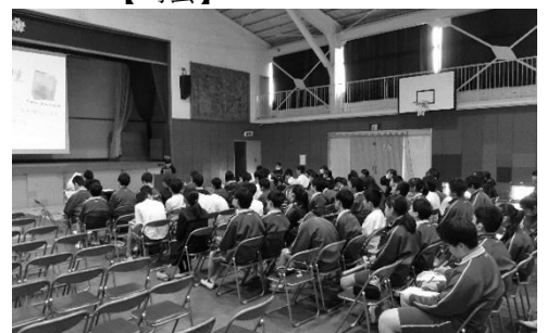
【学年発表会の様子②】