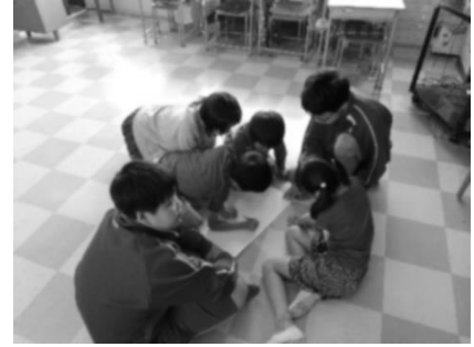
【小学生のゲームに挑戦】