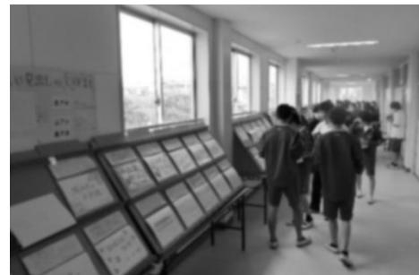
【校内展示：2学年課題探検】