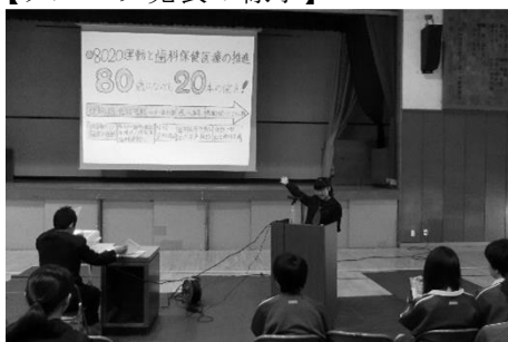
【学年発表会の様子①】