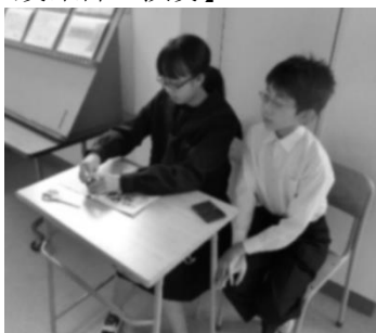
【実行委員企画スタンプラリー】