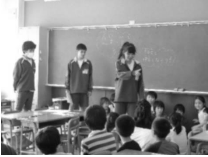
【ゲーム説明の様子】

10月12日(金)5校時に児童生徒交流会が行われました。旭中学校では、中学3年生、小学3、5年生が体育館でゲームや吹奏楽部の演奏などで交流しました。中沢小学校では、中学1、2年生、小学校1、2、4、6年生が20グループに分かれてゲームを行い、交流しました。旭中の2年生はゲームの担当でした。『新聞じゃんけん』で交流を盛り上げました。