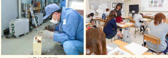
工業技術基礎 カラーデザインⅠ