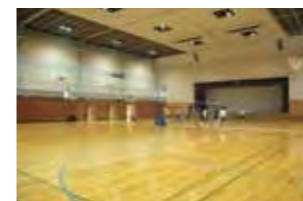
メインアリーナ (体育館)