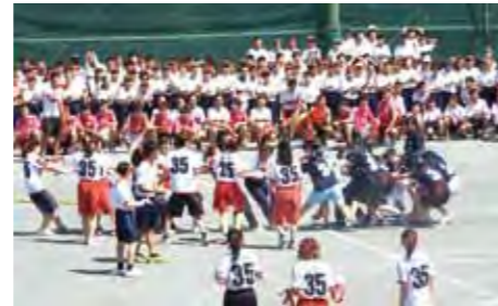
南高祭 体育祭の部