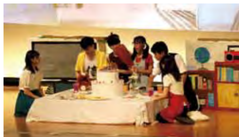
南高祭 舞台の部・風の章 (2年生による演劇)