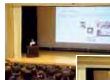
卒業生による進路講演