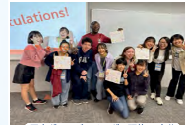
国内グローバルリーダー研修in大分