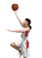
バスケットボール部女子