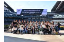
北海道国内研修旅行 (2年)