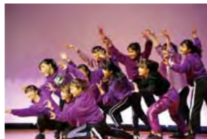
送別フェスティバル