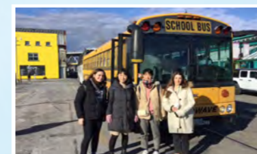
カナダ姉妹校Point Grey Secondary School 訪問