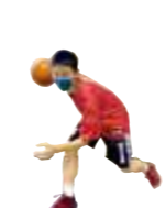
バスケットボール部男子