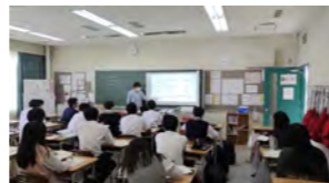
少人数での英語授業