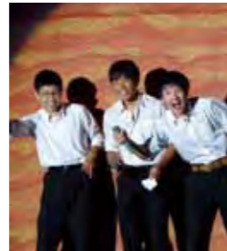
新入生歓迎の集い

期末テスト 合唱コンクール 個人面談 球技大会 夏期講習・補習 国内グローバルリーダー研修 in 広島