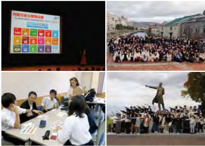
グローバルビレッジ研修