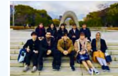
国内グローバルリーダー研修in広島