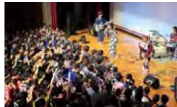
南高祭 後夜祭の部

南高祭 (舞台の部・展示の部・後夜祭の部) グローバルビレッジ研修 (1年) 北海道国内研修旅行 (2年) 中間テスト 国内グローバルリーダー研修 in 大分