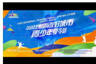
オンラインでの国際交流