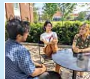
「ATOPからや長海外大学期休業へ進学した南高生」

DePauw大学は、アメリカのインディアナ州にある小規模なリベラルアーツスクールです。リベラルアーツスクールというのは文理関係なく専攻を選ぶことができる学校で、私はここで映画学とデータサイエンスを学んでいます。生徒の多くがグリークライフに入っているのが特徴で、ドラマで見るようなパーティーが盛んです。非常に治安も良く、オープンマインドな人が多いです。遊ぶときは遊び、学ぶときは学ぶ、メリハリのある校風だと思います。また、多様性を重んじている学校で、アジアからの留学生が多いです。日本人学生で協力して、ラーメンフェスティバルや緑日など、日本文化を体験してもらいイベントを行っています。自分の個性を伸ばしつつ、主体的な学びの場としてとても良いところです。後輩が来るのを心待ちにしています!