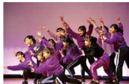
送別フェスティバル