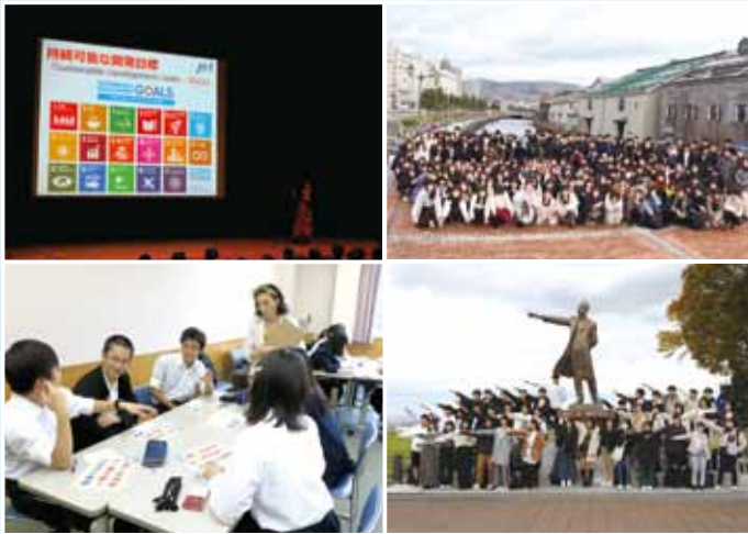
グローバルビレッジ研修