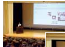
卒業生による進路講演