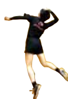
バレーボール部女子