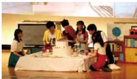
南高祭 舞台の部・風の章 (2年生による演劇)