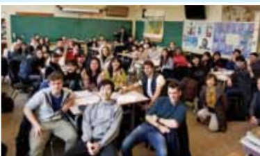
カナダ姉妹校 Point Grey Secondary School 訪問