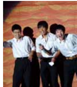
新入生歓迎の集い