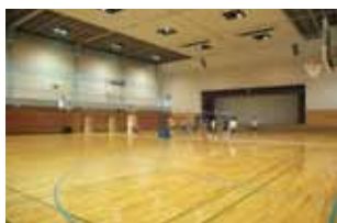
メインアリーナ (体育館)