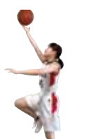
バスケットボール部女子