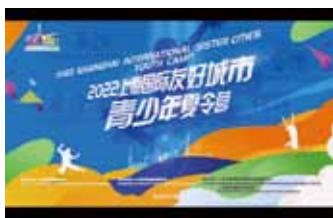
オンラインでの国際交流