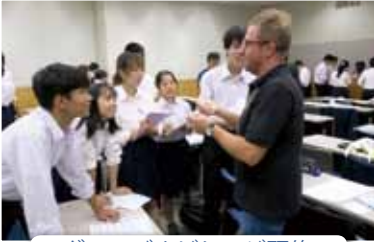
グローバルビレッジ研修