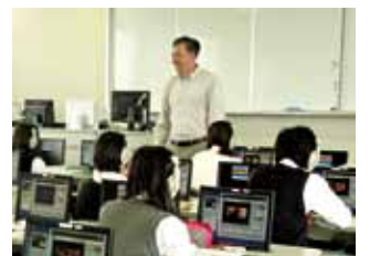
少人数での英語授業