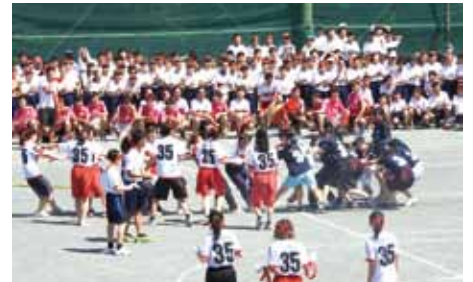
南高祭 体育祭の部