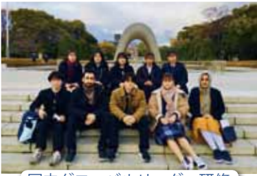
国内グローバルリーダー研修