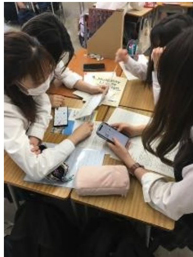
このグループでは「ハマ弁popularプロジェクト」と題し企画を進めています。