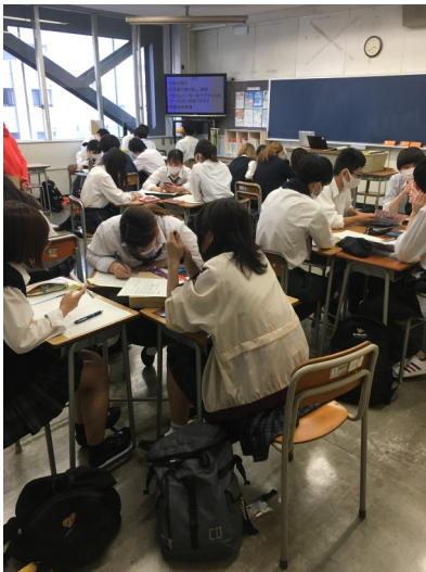
4人のグループに分かれて、活動しています。

3年次の「総合的な探究の時間」では、社会の課題を解決し、持続可能な社会を実現するための企画案にグループで取り組んでいます。単なるアイデアや理想で終わらせないように、実際の企業とのコラボレーションを想定し、明確なターゲットや、必要資源(ヒト・モノ・カネ等)を考慮して企画を練っています。アイデアがまとまったらGoogleスライドを共有し、発表に向けて準備を進めます。今日の授業ではSDGsデザインセンターの方をアドバイザーにお迎えし、企画へのアドバイスをいただきました。