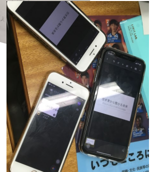
企画が固まったら、Googleスライドを共有して作成します。