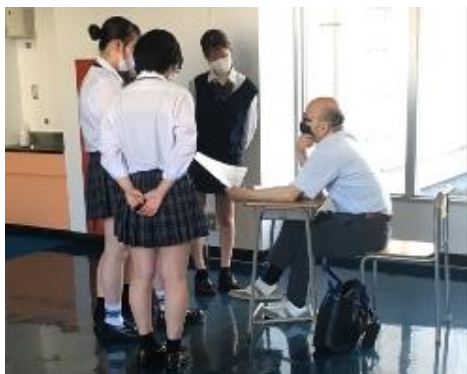
SDGsデザインセンターの方にアドバイスをいただいています。