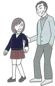
未成年者誘拐被害 ストーカー被害

不特定多数の人に見られる可能性があり、悪意を持った人に利用されてしまう危険性があります。 (公開性・公共性)