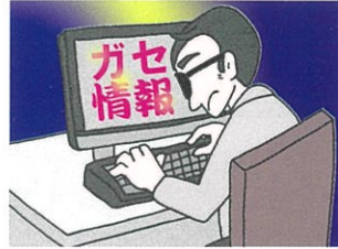
詐欺・風評被害 虚偽情報

インターネット上には、信用できる情報と、そうでない情報が混在しており、結果的に詐欺やニセ情報に翻弄される危険性があります。(信ぴょう性)