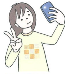
自撮り被害 誹謗中傷

インターネットや SNS に投稿した情報は拡散されやすく、自分ではコントロールが難しくなる危険性があります。 (拡散性・記録性)