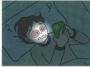
インターネット依存 ゲーム依存・高額請求

情報や娯楽を際限なく追い求めることで、日常生活や勉強がおろそかになったり、オンラインゲームの課金をやめられなくなる危険性があります。 (依存性)