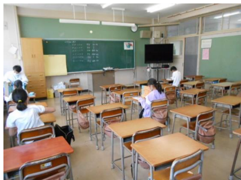
緊急受入れの様子