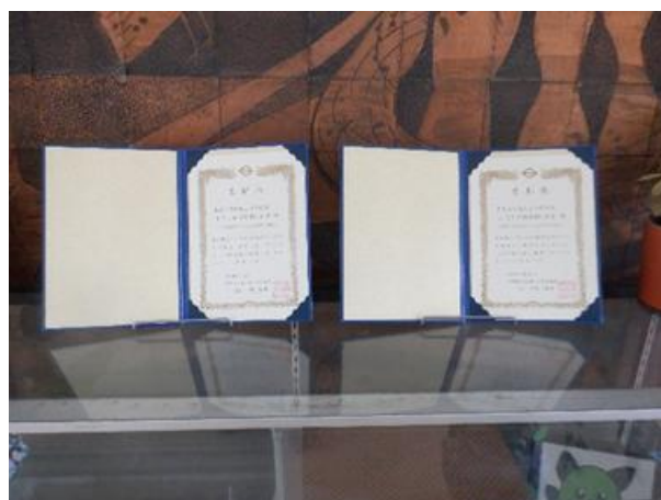
表彰状は職員玄関に飾らせていただいています。