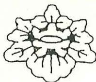
山元小学校 TEL 641-4857