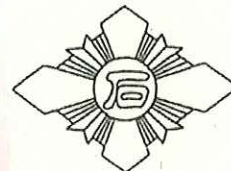
石川小学校 TEL 261-0743