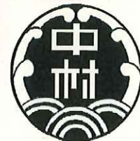
中村小学校 TEL 261-1984