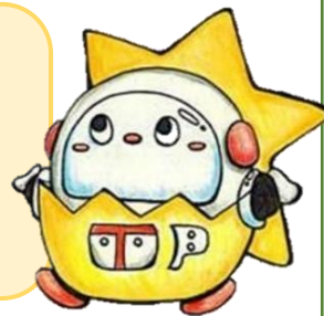
美しが丘のキャラクター プラたまん