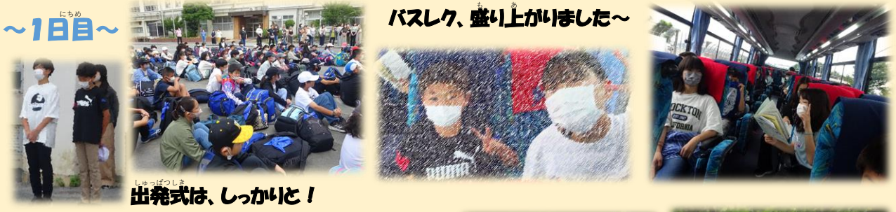
出発式は、しっかりと！