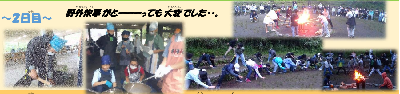
野外炊事がとーっても大変でした・・・