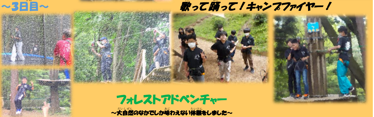
フォレストアドベンチャー