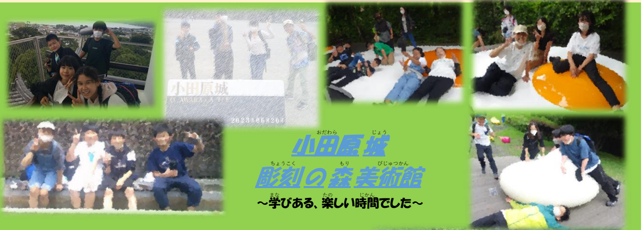
小田原城 彫刻の森美術館 ～学びある、楽しい時間でした～