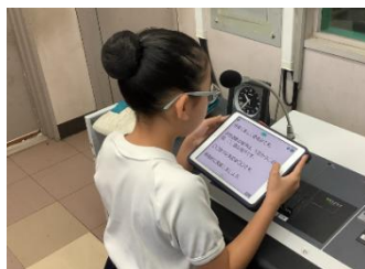
放送での呼びかけ

大人が「いじめ」を決して許さない姿勢を示していくことは大切ですが、「あいさつ運動」のような、子どもたち自身が「いじめ」について考え、未然防止のために行動していくこともとても大切だと考えます。今回の「あいさつ運動」の取組だけでなく、子どもたちがいじめの未然防止のために考えた取組が、全校へと広がっていくように、支援していきたいと思えます。