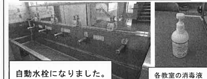
自動水栓になりました。

今年度初の校外学習です。みなとみらいホールで教育委員会主催のコンサートを鑑賞します。鑑賞人数が例年の半分となり、前後左右を空けて着席したり、電車の車両を分けて乗車したりしながらの実施となります。