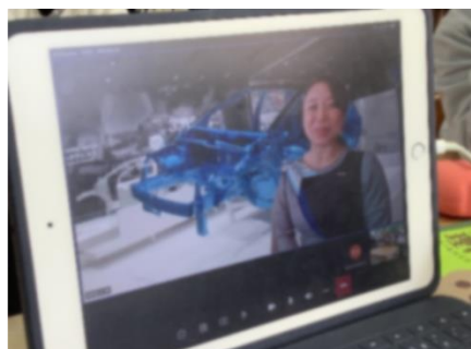
オンライン工場見学(5年生)