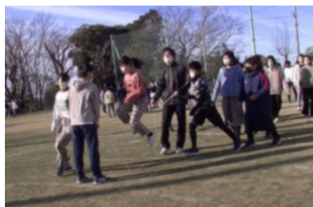
○児童会活動 『長縄集会 ～6年生に挑戦!～』