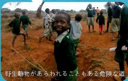
野生動物があらわれることもある危険な道