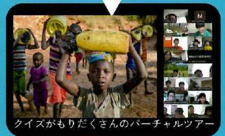
クイズがもりだくさんのバーチャルツアー