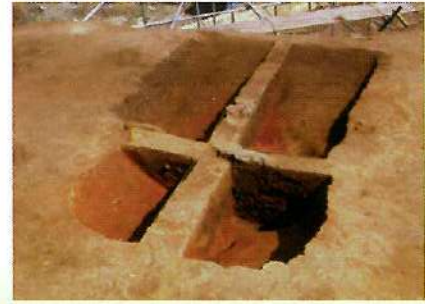
上郷深田遺跡第14号炉遺構断面