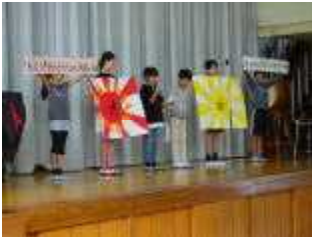
スローガン・シンボルマークの発表

9月29日(土)は、すすき野小学校第45回運動会です。現在運動会に向けて、一生懸命練習をしています！今年は雨天が多く練習にも工夫が必要でした。 本番当日は子どもたちへの盛大な応援をよろしくお願いします。