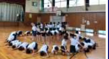
5・6年 演技練習 (創造 ～ One for all ～)