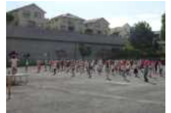
すすき野体操練習