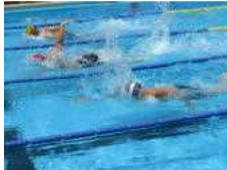
青葉区水泳記録会