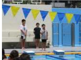
青葉区水泳記録会