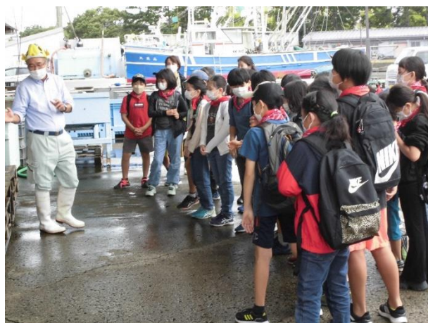
柴漁港でどんな魚がとれているのか説明してくださっていました。