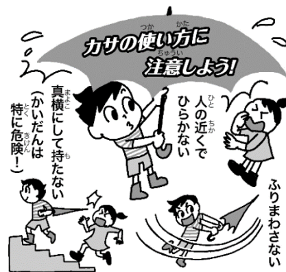
《傘の使い方に注意》

雨や傘で見通しが悪くなって、自動車や人とぶつかりそうになった。水溜りで滑って転んだ、転びそうになった等、雨の日には危険がいっぱいです。