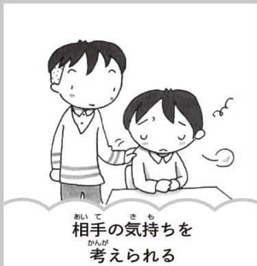
相手の気持ちを考えられる