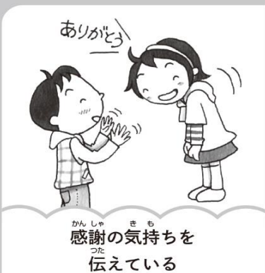
感謝の気持ちを伝えている