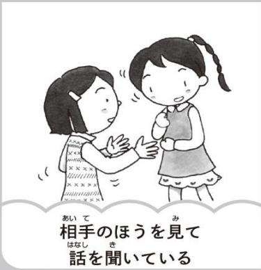
相手のほうを見て話を聞いている