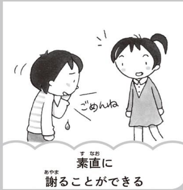
素直に謝ることができる