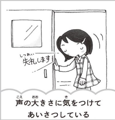
声の大きさに気をつけてあいさつしている