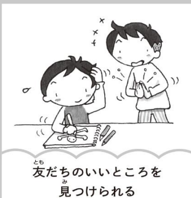
友だちのいいところを見つけられる