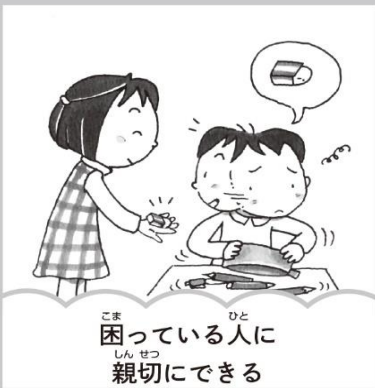
困っている人に親切にできる