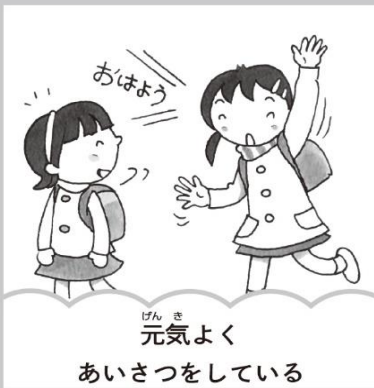
元気よくあいさつをしている