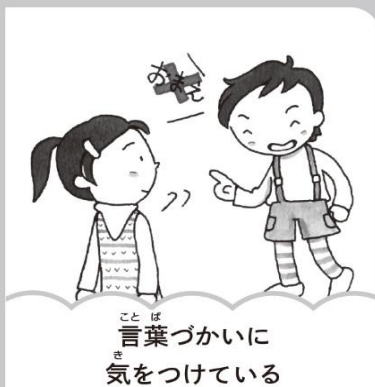
言葉づかいに気をつけている