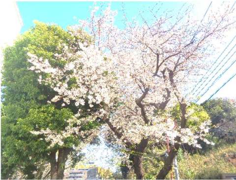
児童門前のさくらです。きれいな花を咲かせ、満開です。