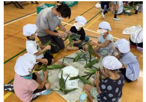
とうもろこしの皮むき