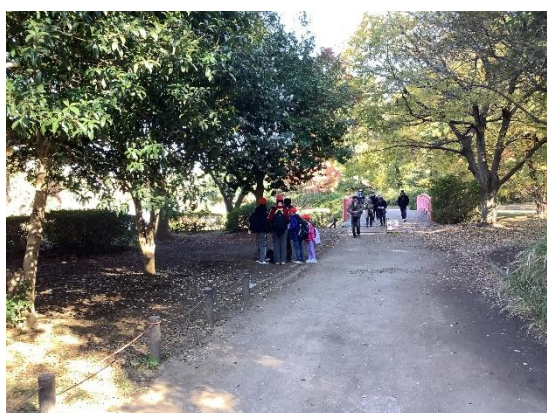
全校遠足での異学年交流の様子