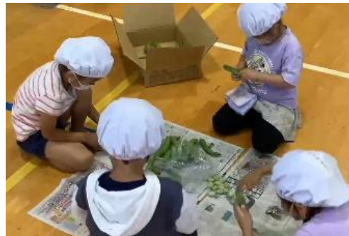
そら豆のさやむき