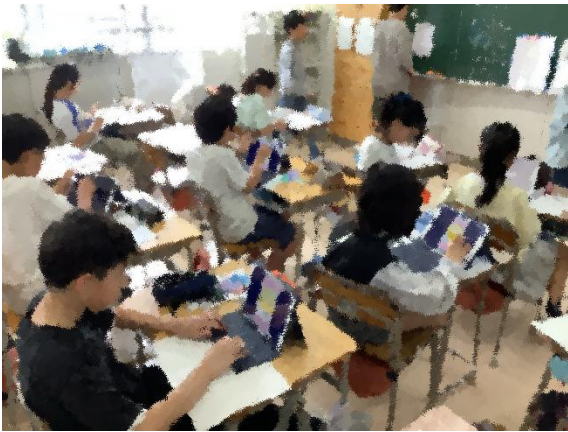
タブレット端末の活用 ～デジタルドリルの活用～