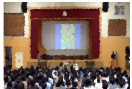
「ONE の会」の読み聞かせ