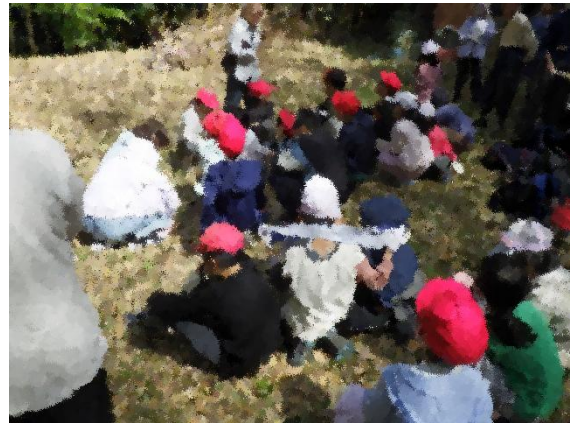
地域をフィールドにした学習 たけのこ掘り