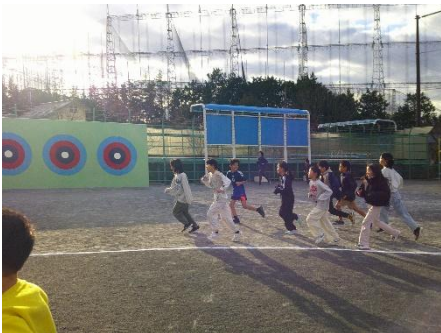
ぼかぼかランニング