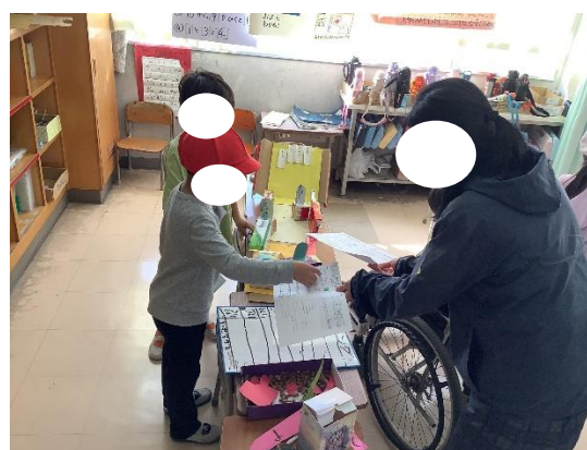
社会福祉法人「ぴぐれっと」との交流の様子