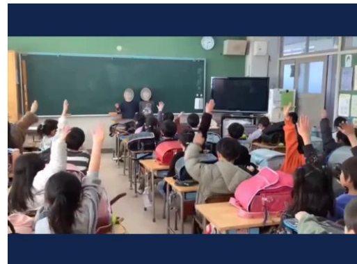
新橋けんこう週間／クラスの健康目標への取り組みと振り返り