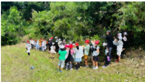
体験的な活動の充実 ～ユリノキタイム～