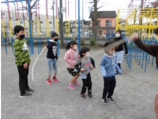
ペア学年集会（長縄）

12月も、子どもたちは友達と楽しく学習を進めることができました。国語の「くじらぐも」の学習では、屋上で音読をし、「しらせたいな 見せたいな」の学習では、学校で飼育されているウサギの様子を観察しました。ペア学年集会も行い、6年生との仲も深めました。