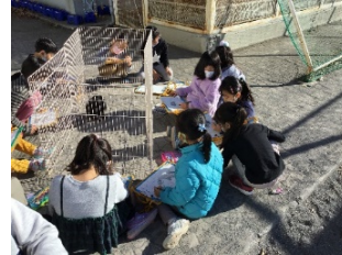
国語「しらせたいな 見せたいな」