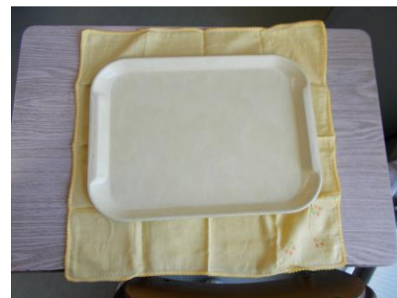
例：大きなハンカチ (写真は 40cm×40cm)