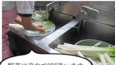
野菜は流水で3回洗います