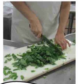
かきたま汁を作ります