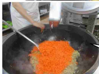
きんぴらを作ります