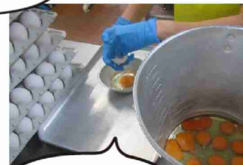
卵を1個ずつ確認しながら割ります