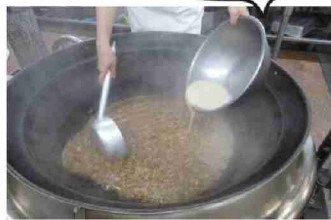
和風ソースを作ります