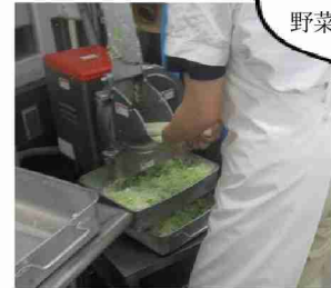
機械や包丁を使い、野菜を切ります