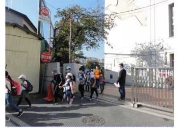
元気よく「行ってきます」と出発しました。