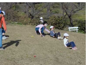
斜面を利用してそりすべり。