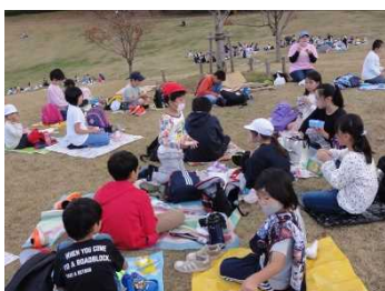
お楽しみのお弁当の時間。みんなで食べるとおいしいね。食べ終わったら、さらに楽しみにしていたおやつタイム。