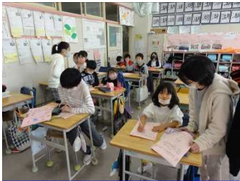
たてわりグループで、しおりを作ったり、活動を決めたり…

11月17日 金曜日、秋の晴れ渡る空の元、大鳥小学校初の取組『全校遠足』を行いました。子どもたちは、縦割りグループで6年生を中心に準備を進め、自分たちの手で作り上げようと取り組みました。