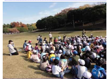
森林公園到着。色ごとに集場所も分かれています。