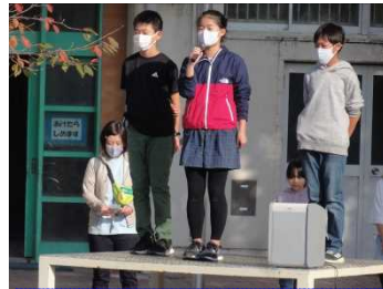
出発式では、赤・黄・青それぞれのリーダーからのお話。