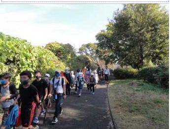
グループでまとまって森林公園まで歩きます。2年生以上の子どもたちは1年生の時の遠足で歩いた道を今回は他の学年の友達と一緒に歩きました。