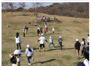
小グループ対抗で対戦したドッジボール。