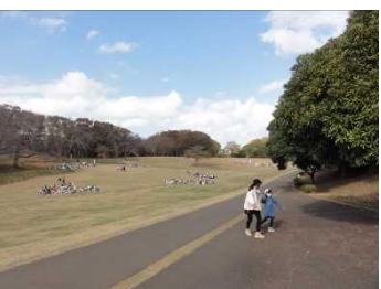
トイレに行くのも高学年が必ずついて行ってくれました。