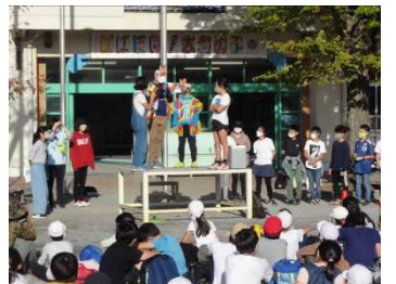
帰校式では、“ゆめさく”や“小ゆめさく”も登場です。