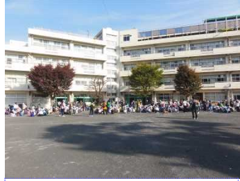
絶好の遠足日和。秋の澄み渡った青空でした。