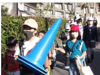
使った道具も忘れずに持ち帰りました。