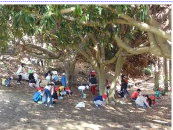
秋らしく、みんなでどんぐり拾いをしたり…