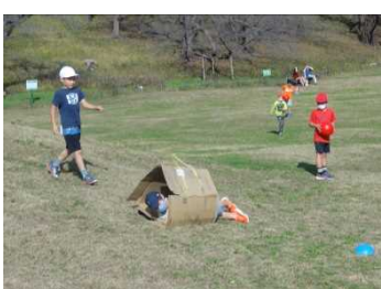
コロコロコロコロ転がって。