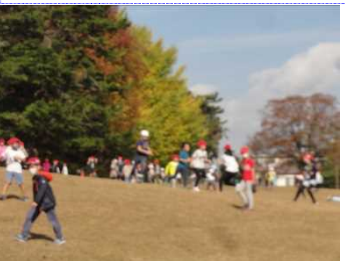
グループごとに活動開始。全員で鬼ごっこをしたり…