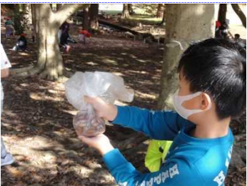
だいぶ拾えたなあ。これで何を作ろうかな…