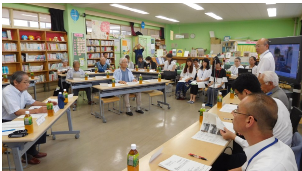
6/22(金) 平成29年度 スクールゾーン対策協議会 5/2のスクールゾーンパトロールや日頃目にしている危険箇所について対策が協議されました。

6月18日の大阪府北部地震で4年生の尊い命が奪われてしまいました。学校のプールを囲っているブロックが崩れたことが原因なので、すぐに本校でもブロックの点検をしましたが、問題ありませんでした。通学路については、校外委員の方にも調査をしてもらっています。今回のように登校中において、地震が起きた場合は、安全を確認した上で壁から離れることと、地震がおさまった後は、自宅か、学校か近い方に逃げることを朝会で話をしました。もし、自宅に保護者の方がいない場合は、基本学校に避難をするということになりますので各家庭でお子さんと確認しておいてください。(帰宅した場合には、子どもの所在を確認したいので、できるだけ早く学校に連絡をお願いします。)今年度の総合防災訓練(8月31日実施)は、毎年行っている引取りのメール配信と共に子どもの安否確認メールも送ります。安否確認メールは、自分の子どもがどこにいるのかを確認するメールです。いくつかの選択肢がありますので(たとえば子どもは学校にいる。子どもは自宅にいる。など)そこをチェックして返信してください。引取り訓練、安否確認訓練とも大切な訓練ですので、ぜひご協力をお願いします。