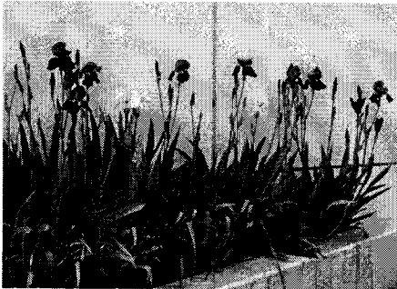
東門に咲いているアヤメ

4月19日(日)に「大口・七島地区地域交流まつり」が開かれました。たくさんの「ぐちっこ」が遊びに来ました。本校6年生は、ソーラン節の演技を発表したりゴミ分別のお手伝いをしたりしました。今年も、浦島小学校の皆さんによる演技発表があり、とてもよい交流ができたと思います。PTAの皆さんも出店しました。たくさんのお客さんがいらして、お昼過ぎには完売しました。地域のみなさんとのふれあいを感ずる楽しい1日でした。