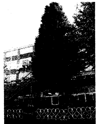
校庭にあるイチヨウの木

読書に適した秋の夜長です。せっかくの機会ですので、そのイチヨウの葉を葉に使いながら「親子での読書」を楽しんでみてはいかがでしょうか。