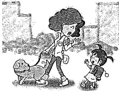
犬の散歩をしながら