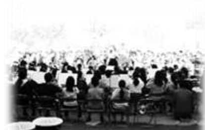
オープニングは特設音楽の演奏です

特設音楽クラブの演奏、出店された色々なお店、スペシャルクイズなど今年も楽しむポイントが盛りだくさんでした。準備して下さった保護者の皆さんありがとうございました。