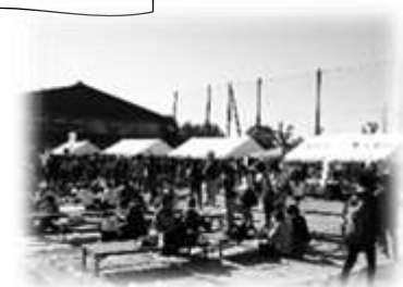
快晴の空の下で楽しく買い物