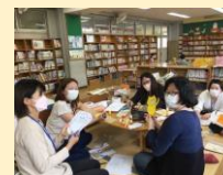
「図書館お助け隊」の様子