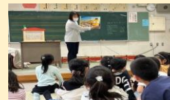
「おはなし会」の様子