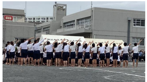
「いざ頂上へ!~かけがえのないきずなとともに~」 最後のポーズもばっちり決まりました!

予行練習の際、休憩後の練習再開時刻より前に率先して整列し、全校のよいお手本になってくれました。運動会のような全校行事は、高学年の「本気」に支えられています。自分の出番だけでなく、係の仕事などに全力で取り組み5・6年生がいたからこそ、全校の一人ひとりが思いきり自分の力を発揮することができたのだと思います。結果発表での得点係児童の「はい!」という返事からは「責任をしっかりと果たそう。」という強い意志が伝わってきました。そして、5・6年生の本気の演技。組体操の技が決まるたびに、低学年が何度も「すごい!」と言っていたのが印象的でした。並一カップは終わってしまいましたが、これからもさまざまな場面で子どもたちの輝く姿がたくさん見られるよう、教職員一同、力を尽くしてまいりますので、引き続きあたたかく見守っていただければ幸いです。