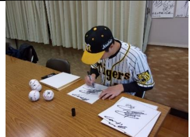
各クラスにサインを書いてくれました。