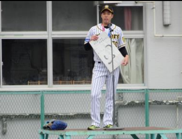
本の紹介をしてくれました。