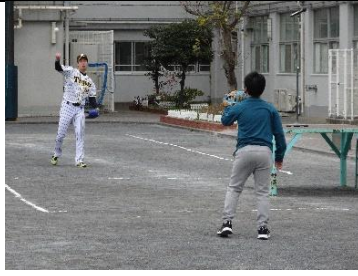
児童とキャッチボールのサプライズ!