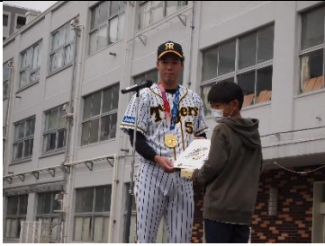
図書委員長が代表して受け取りました。