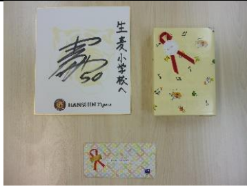
本と図書券とサインをいただきました。