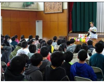
子どもの頃の話をとくさんしてくれました。