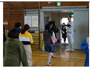
最後はグータッチでお別れです。