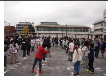
近くまで選手が来てくれました。