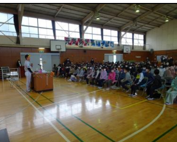
5,6年生に「夢をつかむには」の講演