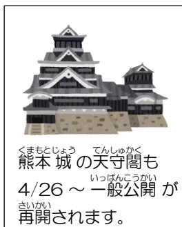
くまもとじょう てんしゆかく 熊本城の天守閣も 4/26～一般公開が再開されます。