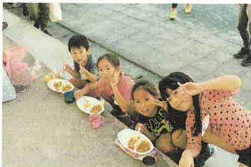
おいしいカレーを食べて、みんな笑顔。

子どもたちは日々の学校生活の中で顔の見える関係を作っていますが、大人は忙しさを理由にインターネットなどによる顔の見えない関係にとどまっているように思います。よき協力相手、相談相手と知り合う機会を大切にしないのはもったいないと思うのですが、いかがでしょうか？