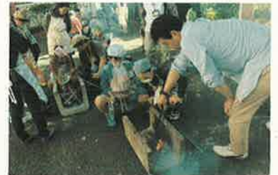
火おこしも上手にできました。

9・10月は体験学習や地域の行事がたくさん行われました。金沢区野島で行われた3・4組の南区合同宿泊学習、4・5年生の足柄体験学習では、一泊二日でいろいろな体験をして楽しみました。同じ釜の飯を食べることで、絆がさらに強いものになりました。