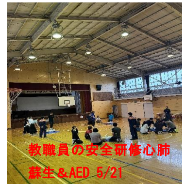
教職員の安全研修心肺蘇生&AED 5/21