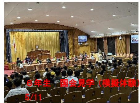
6年生 国会見学（模擬体験） 5/11