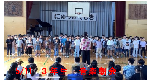
5/11 3年生 音楽朝会

だからこそ大切なのは「話し合い」です。相手を責めるためではなく、「仲よく生活するために話し合う」ことの大切さを、これからも子どもたちに伝えていきたいと考えています。