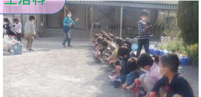
1年生 お花いっぱいコーナーに植えるスイートピーとえんどうまめの種まきをしました。