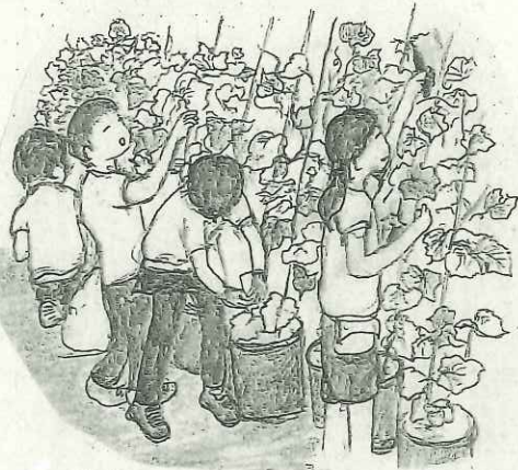
2年生 バケツで育てている キュウリのお世話です