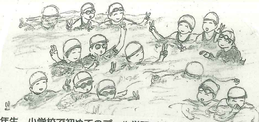
3年生 小学校で初めてのプール学習です