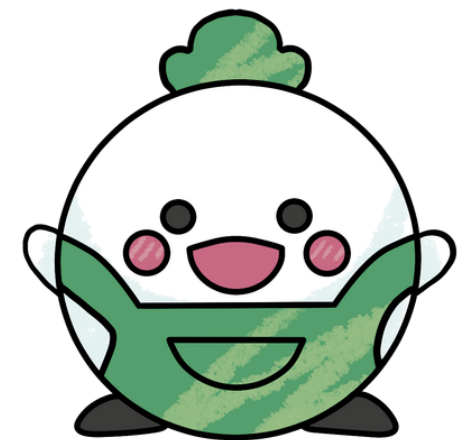
森の台小学校20周年キャラクター もりんくん