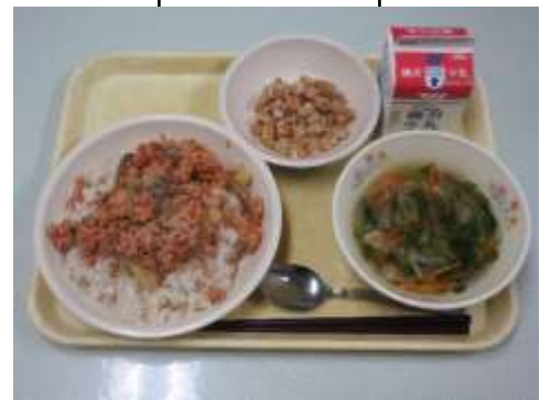
はいがごはん、牛乳 秋味ごはんの具 揚げだいず、沢煮椀