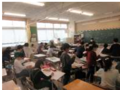
4年生 図工 言葉から形・色