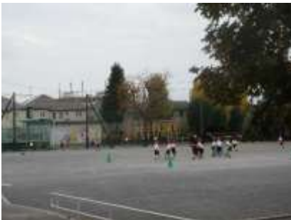
3年生 体育 体づくり運動