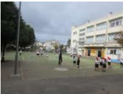
1年生 体育 とんとんでジャンプ