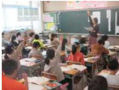
2年生 国語 お手紙