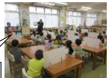
5校時、1年1組の児童に かさじぞうを読みました。