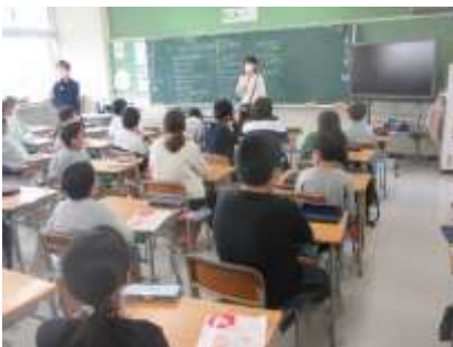
5年生 体育 心の健康