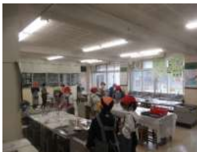
6年生 家庭 食べて元気に