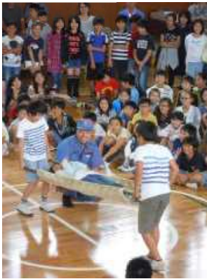
実際にやってみました!