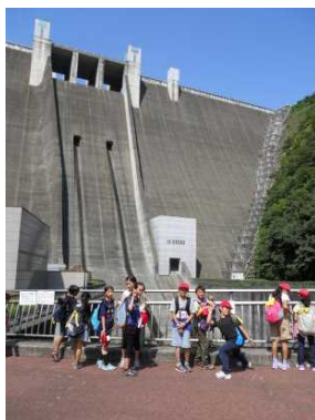
宮ヶ瀬ダムをバックに…