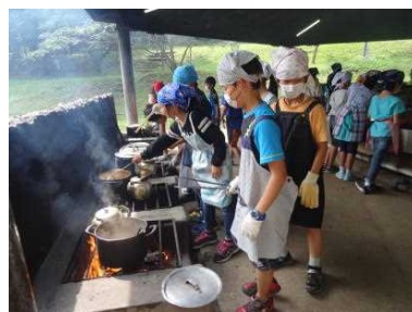
おいしそうにできたかな