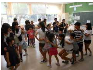
教室で一緒に遊びます