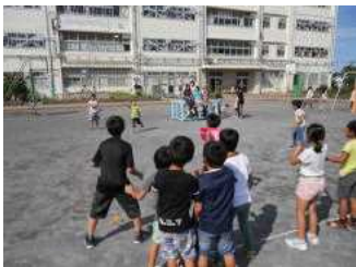
校庭でも遊びます

21日(木)、ペア交流給食が行われました。ペア学年でグループを組み、楽しく給食をいただきました。この日のメニューは、「はいがごはん、秋なすカレー、ごま酢あえ、ブルーはっこう乳」でした。給食当番は、そのクラスが準備、片付けは上学年が担当しました。はじめは隣にも前にもペア学年の子がいる状況にとまどっている様子もみられましたが、徐々に打ち解けてきて、楽しく談笑しながら会食できました。どのクラスもいつもよりたくさん食べていたように思います。