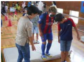
段差では声かけて!

29日(金)、福祉体験を行いました。社会福祉協議会の方からお話を伺い、目の不自由な方々の生活や、盲導犬のこと、目の不自由な方々にどう周囲の人々が接したらよいかということなどを教えていただきました。