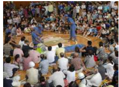
簡易担架の作り方を教えてもらい...

訓練が終わった後で聞いてみると、家に水や非常食などの備蓄品がない(知らない)という子が多く、防災意識が高まったのではないかと思います。