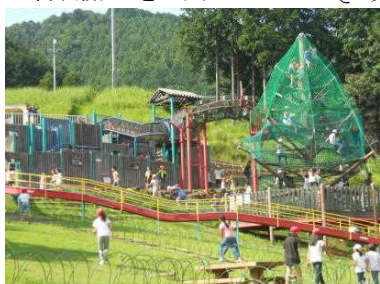
あいかわ公園で遊ぶ、遊ぶ

5年生は、14日(木)、15日(金)と、愛川宿泊体験学習に行ってきました。天候に恵まれ、1日目の宮ヶ瀬ダム見学、あいかわ公園ハイキング、服部牧場見学、キャンプファイヤー、そして2日目の野外炊事と、全てのプログラムを実施することができました。