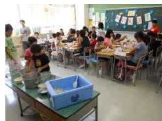
1年生、おかわりしますね~