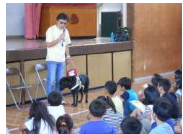
真剣に話を聞きます

「アイマスクをすると本当に何も見えなくて、思ったより怖かった」「もし困っている人がいたら、自分が助けたいと思った」などという感想が聞かれました。体験を通して、自分たちにできることは何か、よく考えるきっかけになりました。