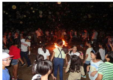
キャンプファイヤーで盛り上がる