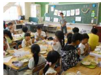
みんなでいただきます!

「ふだんクラスで見せているのとは違う友達の姿が見られてよかった」とは、さすが6年生。下級生を優しく引っ張る姿は、立派なお兄さん、お姉さんに見えたことでしょう。そのような上級生の姿を見て、下級生の子どもたちにも多くの学びがあり、たいへん充実した活動になりました。