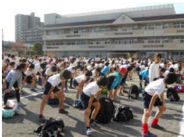
準備体操、いよいよ始まります

11月17日（金）、森の台小学校で、森の台小と三保小の5年生が参加して、緑区球技交流会が行われました。校庭でサッカー、体育館でバスケットボールと、熱戦が繰り広げられました。子どもたちからは「試合には勝てなかったけれど得点を決めることができうれしかった。」「練習してきたことが試合にいかせてよかった。また、森の台小学校の人と交流できたことがうれしかった。」「練習や試合を通して、友達と協力する大切さを知ることができたのでこれからの生活でもいかしていきたい。」などの感想が聞かれました。