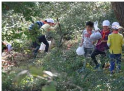
いいもの見つかった?

11月7日(火)、1年生は四季の森公園に行ってきました。これまで天神の杜公園、念珠坂公園と、秋探しに出かけましたが、四季の森公園でも秋探しができることを知って、子どもたちはとても楽しみにしていました。公園では、どんぐりや落ち葉を拾い集めたり、展望台から遠くを眺めたり、遊具やジャンボすべり台で遊んだり、みんなで仲良くお弁当を食べたりと、友達と一緒に楽しく活動する姿が見られました。