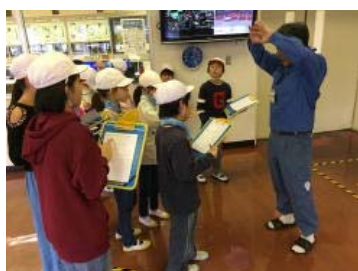
中央管制室前で説明を聞きます

11月10日(金)、都筑区にある資源循環局都筑工場に社会科見学に行ってきました。自分たちが出したごみがどうなるのか、分別された資源はどのように生まれ変わるのか、見学を通して学ぶことができました。都筑工場で使われているクレーンの大きさに驚きの声をあげ、焼却の際に出るエネルギーで発電していることにも気づくことができました。大切なのは、学んだことを自分たちの生活にいかしていくことです。その大きなきっかけとなった見学でした。