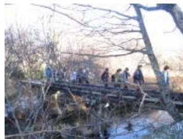
あおき橋を渡ってあと半分！