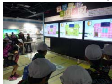
こちらは東芝未来科学館

子どもには興味深いお菓子工場だけに、好きなお菓子が出来上がるまでの行程を真剣なまなざしで見学できました。子どもたちは、工場内にあるチョコレートタンクの大きさにびっくり。チョコレートやキャンディが様々な工程を経て製造される様子を見て驚いていました。安全や