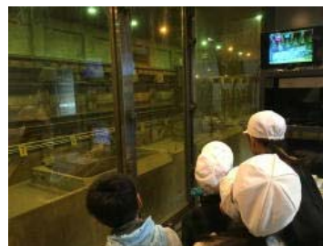
とにかく大きい巨大クレーン

11月10日(金)、都筑区にある資源循環局都筑工場に社会科見学に行ってきました。自分たちが出したごみがどうなるのか、分別された資源はどのように生まれ変わるのか、見学を通して学ぶことができました。都筑工場で使われているクレーンの大きさに驚きの声をあげ、焼却の際に出るエネルギーで発電していることにも気づくことができました。大切なのは、学んだことを自分たちの生活にいかしていくことです。その大きなきっかけとなった見学でした。