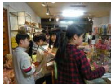
お土産どれにしようかな