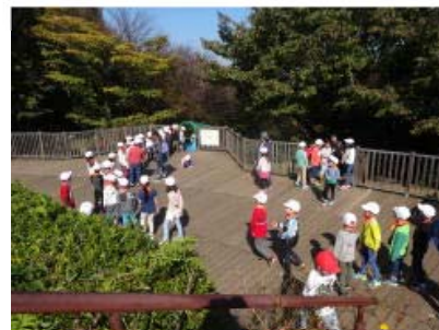
ジャンボすべり台には行列が...

11月7日(火)、1年生は四季の森公園に行ってきました。これまで天神の杜公園、念珠坂公園と、秋探しに出かけましたが、四季の森公園でも秋探しができることを知って、子どもたちはとても楽しみにしていました。公園では、どんぐりや落ち葉を拾い集めたり、展望台から遠くを眺めたり、遊具やジャンボすべり台で遊んだり、みんなで仲良くお弁当を食べたりと、友達と一緒に楽しく活動する姿が見られました。