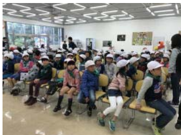
お菓子を食べてちょっと一息