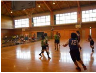
バスケットボール