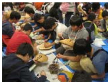
ふくべ細工の絵付け