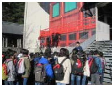
大修理中の輪王寺（絵です）

今年度の修学旅行は2日間とも天候に恵まれ、大きな怪我や事故もなく、子どもたちの頑張りや成長が多く見られた修学旅行となりました。この修学旅行での仲間とのたくさんの思い出は、子どもたちにとって特別な宝物となったことでしょう。