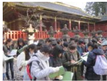
三猿の前でクイズに答えます