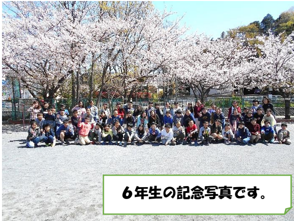
6年生の記念写真です。