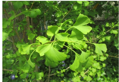
こたえ ( イチョウ )