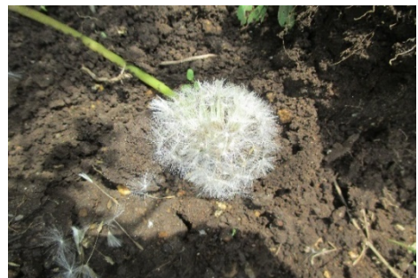
こたえ ( タンポポ )