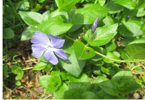
こたえ ( ツルニチニチソウ )